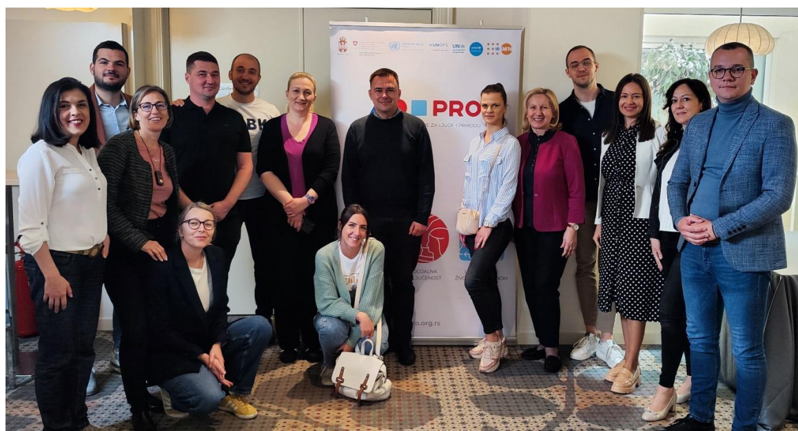
Слика 2 - Дводневни радни састанак са представницима и представницама Канцеларија за младе и јединицама локалне самоуправе

Мандат Радне групе завршен је у мају 2024. године, када су Министарство туризма и омладине, Популациони фонд УН у Србији и Фондација Ана и Владе Дивац наставили прикупљање података и финализацију Индекса благостања младих, укључујући прво мерење за 2023. годину.