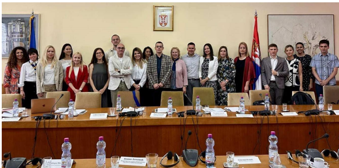
Слика 1 - Састанак Радне групе у Палати Србија

Паралелно са радом Радне групе, Министарство туризма и омладине, Популациони фонд УН у Србији и Фондација Ана и Владе Дивац организовали су два дводневна радна састанка са представницима канцеларија за младе и јединица локалних самоуправа како би представили значај Индекса, дефинисали циљане вредности за локални ниво и унапредили прикупљање података кроз развој стандардних описа индикатора.