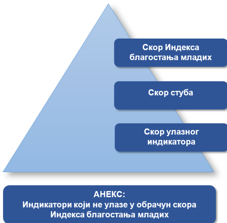
Приказ 2 – Схема добијања укупног скорa Индекса благостања младих

Индекс благостања младих може имати скор од 0 до 100, при чему виши скор индекса значи квалитетнији ниво живота младих у Републици Србији на националном и локалном нивоу и виши степен реализације Стратегије за младе у Републици Србији за период од 2023. до 2030. године.