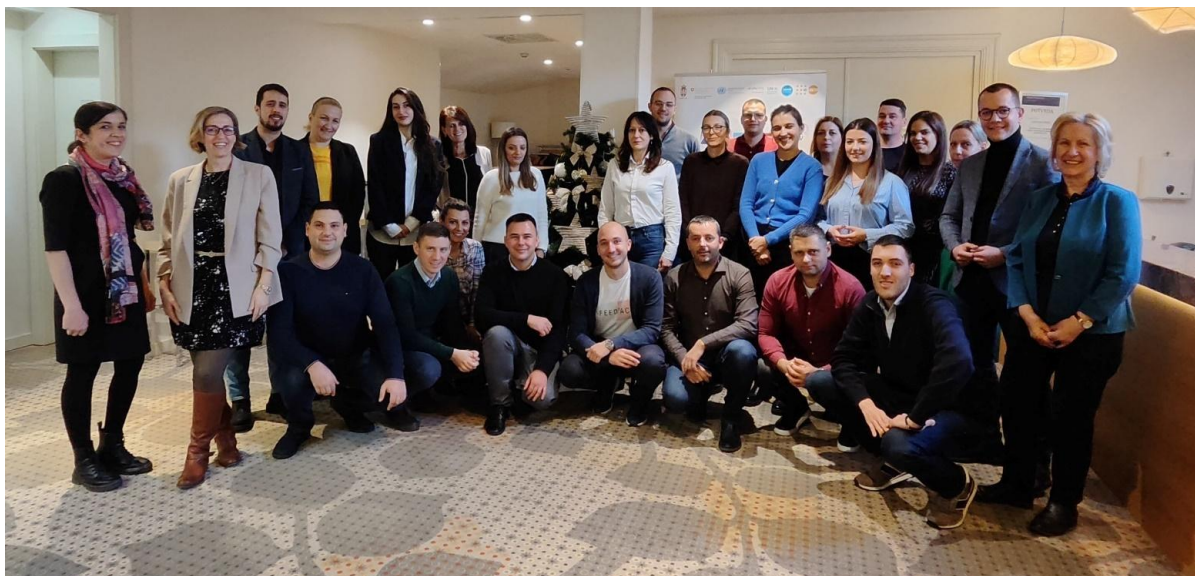
Слика 3 - Дводневни радни састанак са представницима и представницама Канцеларија за младе и јединицама локалне самоуправе и члановима и чланицама Радне групе за израду сложеног Индекса благостања младих