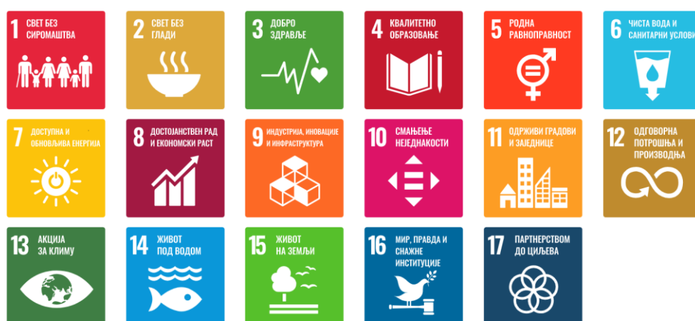
Приказ 1 – Циљеви одрживог развоја

Индекс благостања младих називамо сложеним или композитним будући да обједињује вредности великог броја показатеља односно тзв. улазних индикатора.